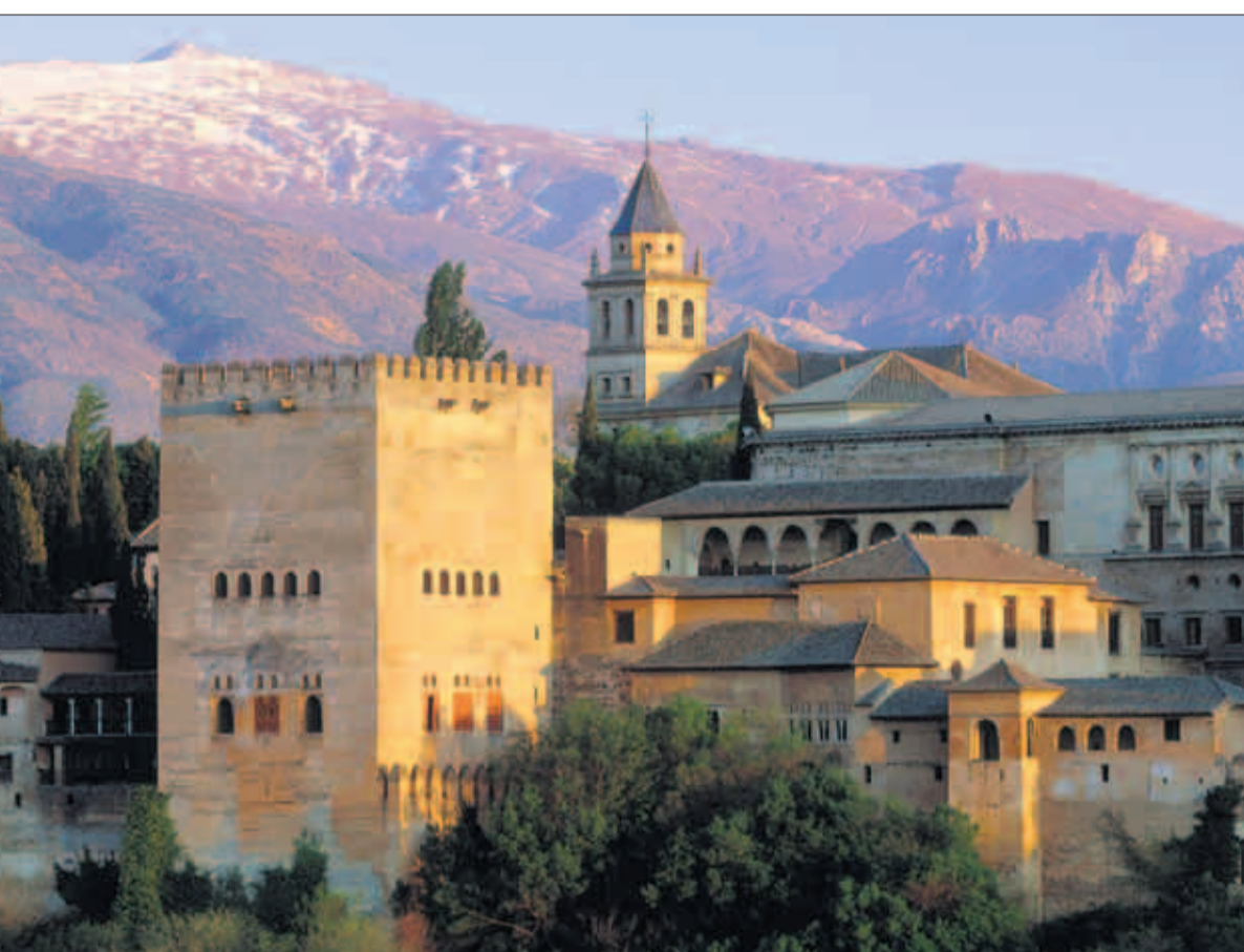
Die Alhambra in Granada, Spanien, ist seit 1984 Weltkulturerbe.